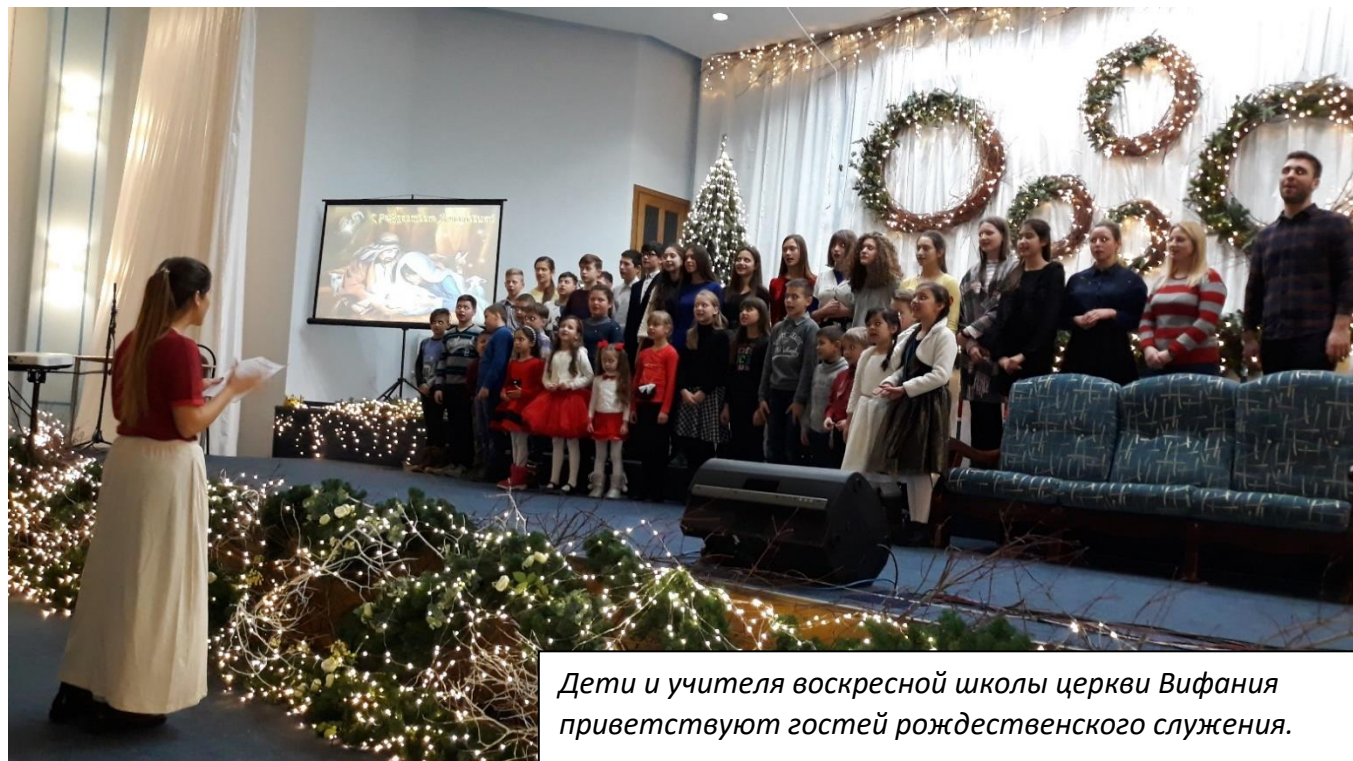
Дети и учителя воскресной школы церкви Вифания приветствуют гостей рождественского служения.

церкви. Молодежь подготовила рождественскую постановку. Прозвучала краткая проповедь. И в заключении все дети получили подарки.